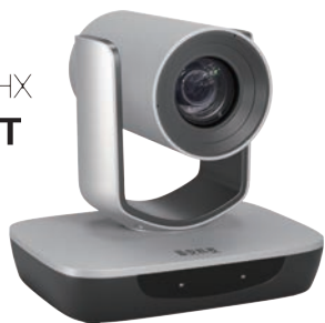
AMC-G320/G312 AMC-NG320/NG312(NDI HX)